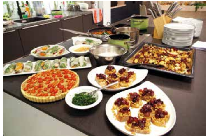
Bio-Kochkurs Vegane Herbstküche 2023

Tauchen Sie ein in die Welt der Bio-Küche und lassen Sie sich von den kulinarischen Highlights der Öko-Modellregion Steinwald begeistern!