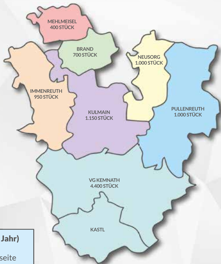
PULLENREUTH (erscheint 4x im Jahr)